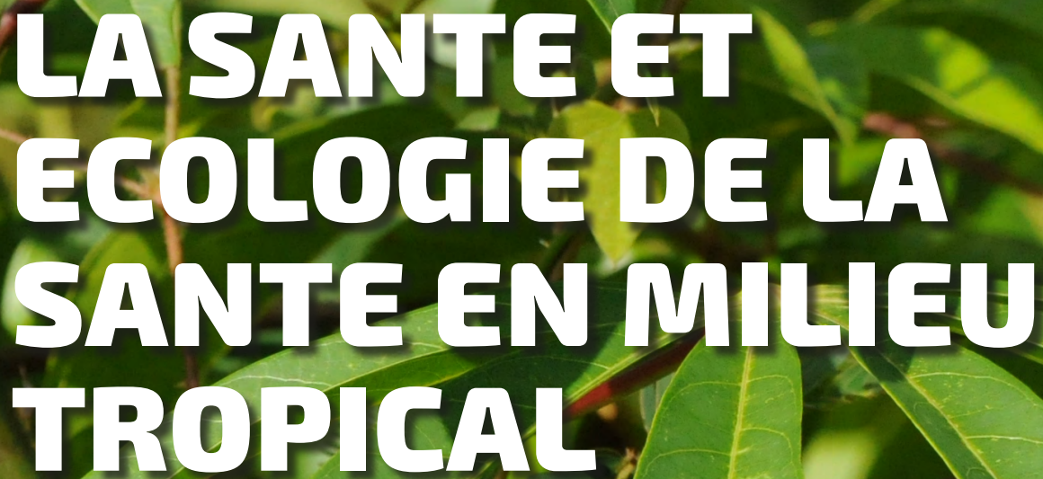
Fig. 1 : Partie aérienne du manioc amer ( Manihot esculenta ). Image publié originalement dans l'article de Frontiers in Nutrition. Crédit photo : A. Cuerrier