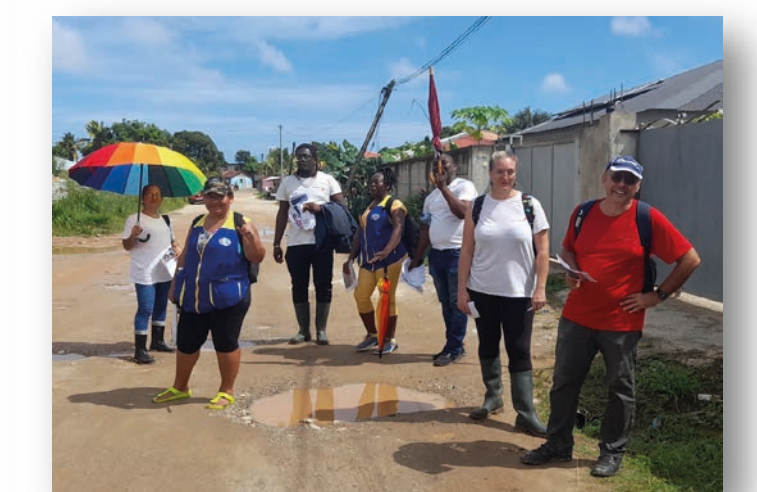
Sensibilisation dans les quartiers CRF, DAAC, AAPSE