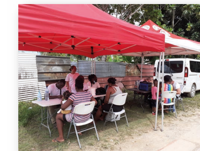
Recueil de données à Sablance