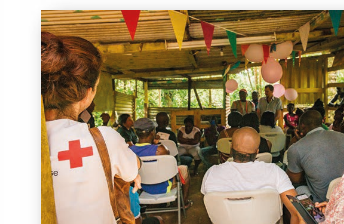
Réunion de restitution publique Boutillier