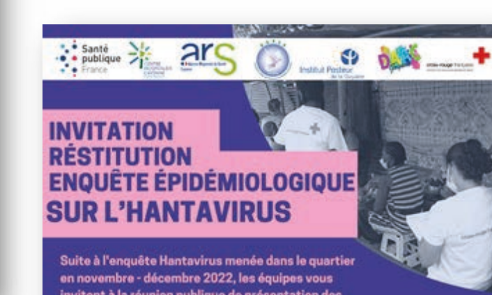
Invitation restitution enquête épidémiologique sur l'hantavirus