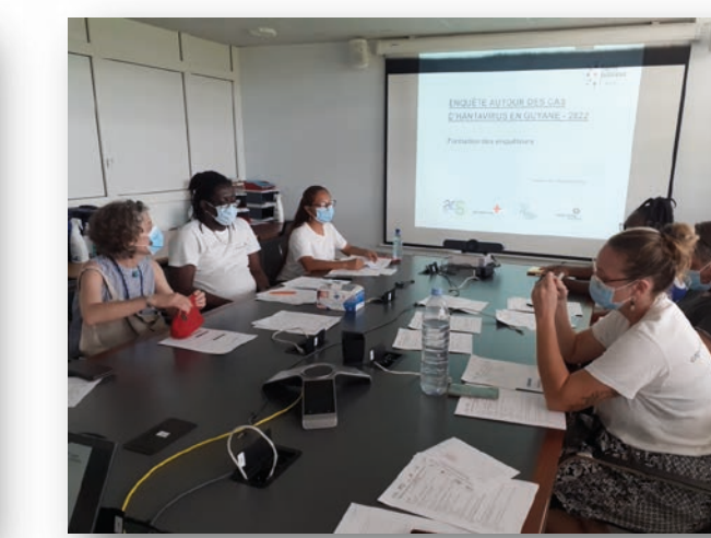
Présentation protocole d'enquête, SpF