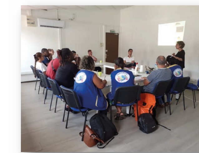
Formation Hantavirus CHC & IPG