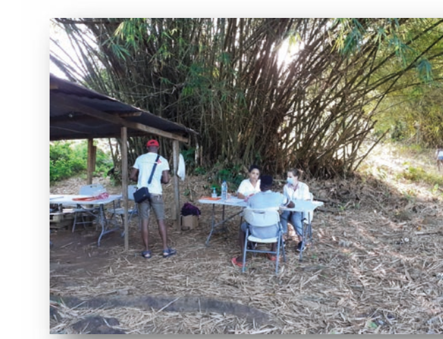
Remise des résultats individuels Boutillier