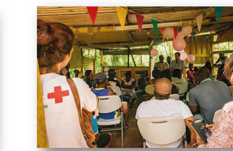
Réunion de restitution publique Boutillier