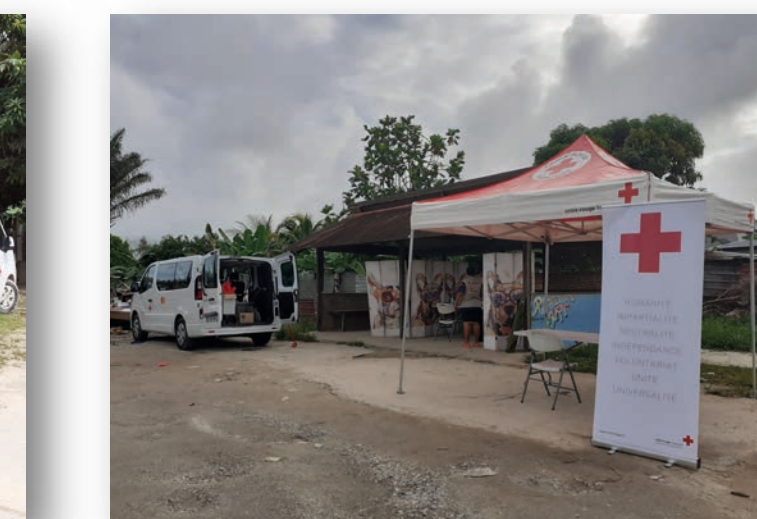
Recueil de données à Sablance