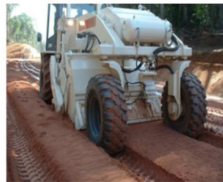
Traitement de la couche de forme - Route d' Apatou