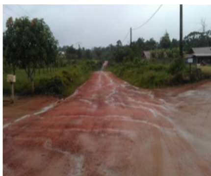
Piste de Rococoua / Commune d'Iracoubo

Les routes départementales sont plus petites (type « routes de campagnes ») qui supportent un trafic moins dense. Elles desservent les villages du littoral. La longueur totale du réseau départemental était de l'ordre de 400 km en 2005. La traversée des petits cours d'eau se fait par l'intermédiaire de chaussées posées sur des buses, tandis que les fleuves et rivières sont traversés par des ponts.