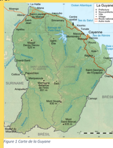
Figure 1 Carte de la Guyane

cente (à Régina, le pont sur l'Approuague fut inauguré en 2004), des pirogues, puis des bacs, transportaient personnes et marchandises, ainsi que véhicules d'une rive à l'autre.