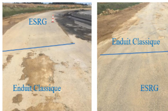
Figure 6 - Expérimentation sur le chantier Ariane 6 - Trafic chantier

Renforcement d'un tronçon de voirie de chantier dans le cadre des travaux d'Ariane 6. Constat : L'on remarque clairement la différence en terme de durabilité entre l'enduit classique et l'ESRG, après un an de service avec un trafic de type poids lourds. Figure