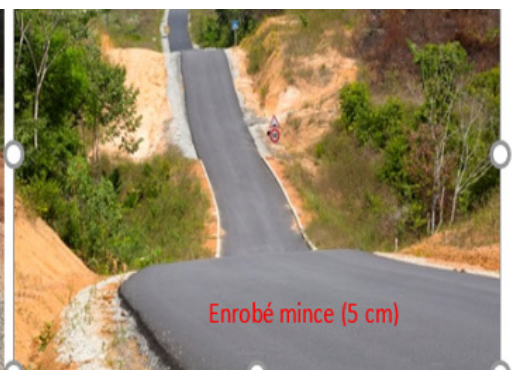
Enrobé mince (5 cm)