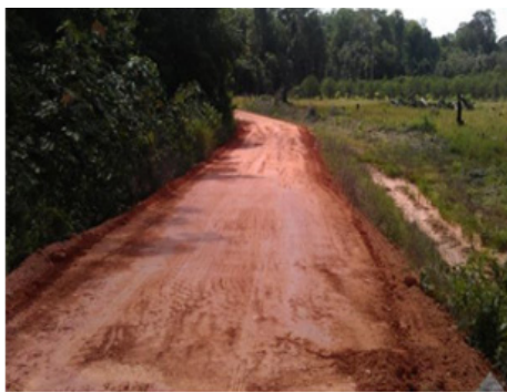
Piste de Rococoua / Commune d' Iracoubo