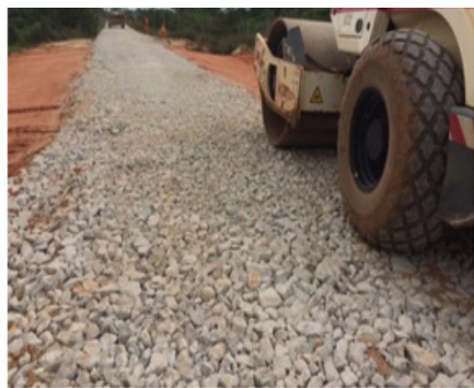
Couche de forme en Grave – Pistes agricoles de Wavabo / commune de