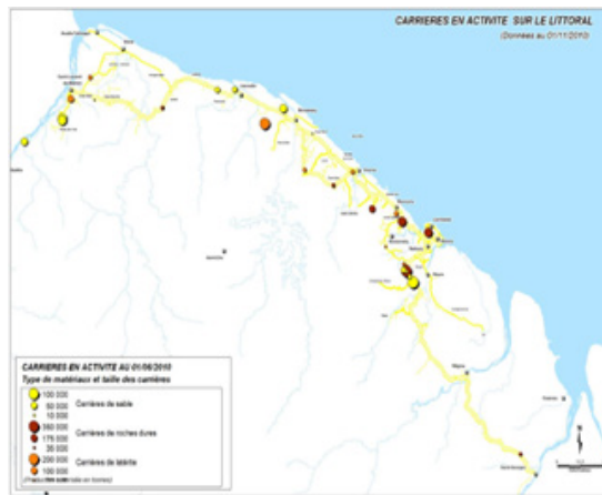
Figure 1 Carrières en activité sur le littoral Guyanais en 2010

D'après l'USIRF 2015 (L'Union des syndicats de l'industrie routière française), le coût d'un kilomètre (revêtement + réfection structure de chaussée) d'une route départementale est de l'ordre de 300 k€.