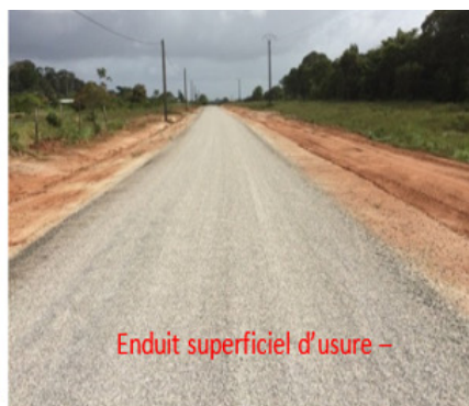
Enduit superficiel d'usure -