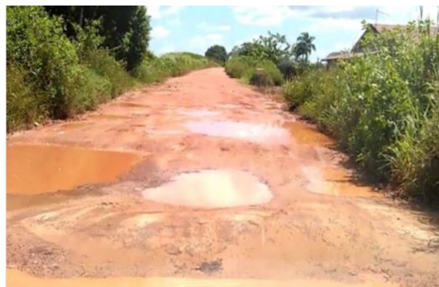
Figure 1 Piste agricole de Javouhey - Commune de Mana

ditionnelles voiries à faible trafic deviennent rapidement des gouffres financiers. Les pistes forestières restent le seul moyen de désenclaver les communes rapidement et à faible coût. Cependant, les intempéries rendent les pistes difficilement praticables, et nécessitent beaucoup d'entretien (Ex : Figure 1 )