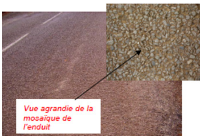
Figure 4 - Bon état général de l'enduit en Guyane

Cette technique consiste à déposer un géotextile sur un épandage d'émulsion de bitume et à le recouvrir par un enduit superficiel d'usure. Des premières expérimentations sur ce procédé ont été réalisées en Guyane sur la RN2 en 1985 et 1987 sur une durée d'environ 20 ans et également dans l'Hexagone sur la départementale RD 65 en Seine Maritime en 1989. Il en ressort que les Enduits Superficiels Renforcés par Géotextile restent en bon état sur une vingtaine d'années sauf dans les zones où il existe une insuffisance notable de portance du sol.