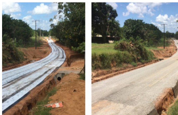
Figure 7- Expérimentation sur la route Paul-Castaing commune de Saint-Laurent du Maroni

Réhabilitation de 1,7 kilomètres piste avec le procédé ESRG en Aout 2018 - Etat général de la chaussée après deux ans de service : très bon.