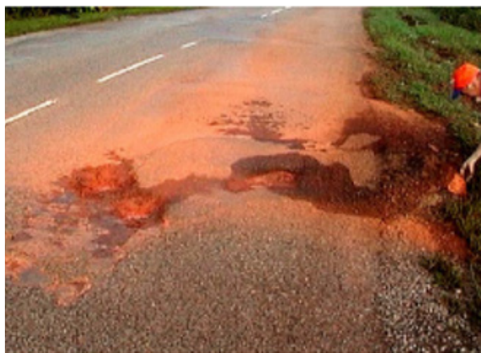
Figure 5 Dégradation en rive (19 ans de service en Guyane)

D'autres expérimentations ont été réalisées dans le cadre d'une thèse de doctorat en partenariat entre l'Université de Guyane et l'entreprise EIFFAGE Infra Guyane qui sont les suivantes :