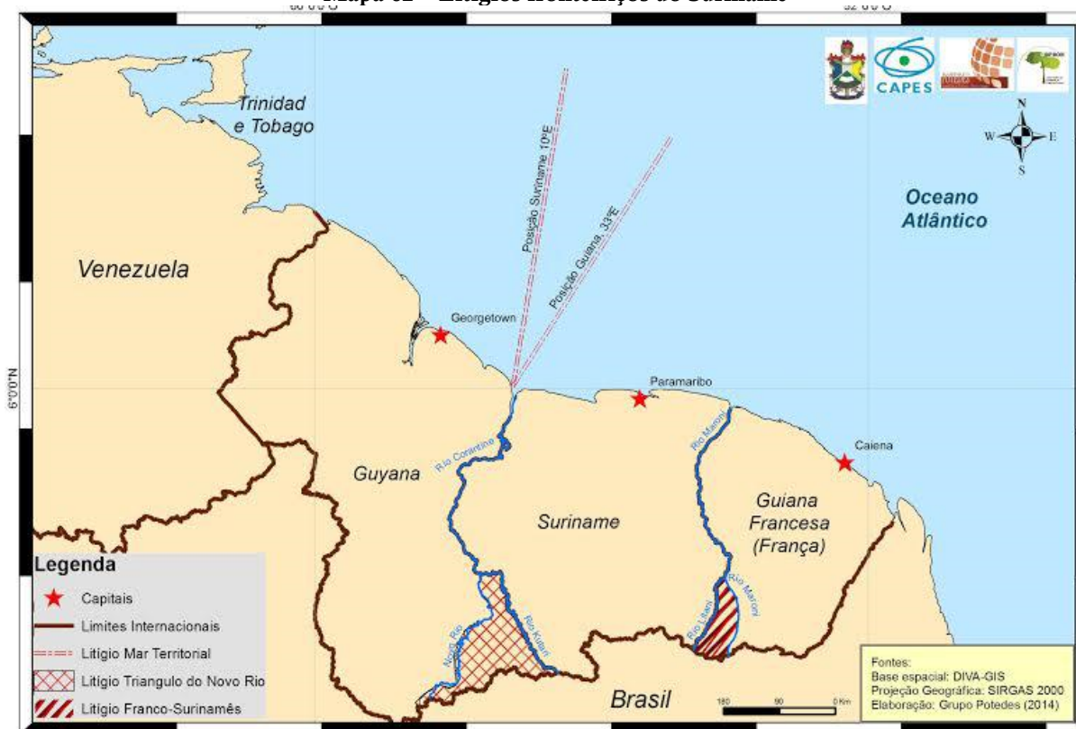
Mapa 02 – Litígios fronteiriços do Suriname