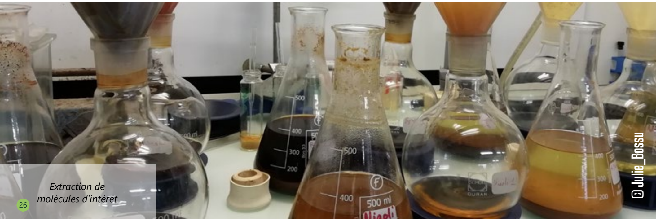
Extraction de molécules d'intérêt

Au-delà des aspects de préservation naturelle, d'autres composés issus de substances naturelles peuvent être employés pour développer des adhésifs naturels ou encore des additifs pour améliorer d'autres propriétés comme la réaction au feu des matériaux. D'autres projets sont actuellement développés en ce sens au laboratoire des sciences du bois d'EcoFoG, en collaboration avec l'unité BLOWOEB (CIRAD, Montpellier). Issus d'approches multidisciplinaires mêlant science du bois, biotechnologie et chimie verte, ces innovations ont le potentiel d'aboutir à des produits à très forte valeur ajoutée et à faible impact environnemental. Pouvant être produits et utilisés localement, ces nouveaux éco matériaux sont plus durables que les produits commerciaux correspondants, et se montrent plus adaptés aux contraintes de mise en œuvre en milieu équatorial. Ils représentent une réelle opportunité pour développer de nouvelles filières industrielles performantes et durables en Guyane.