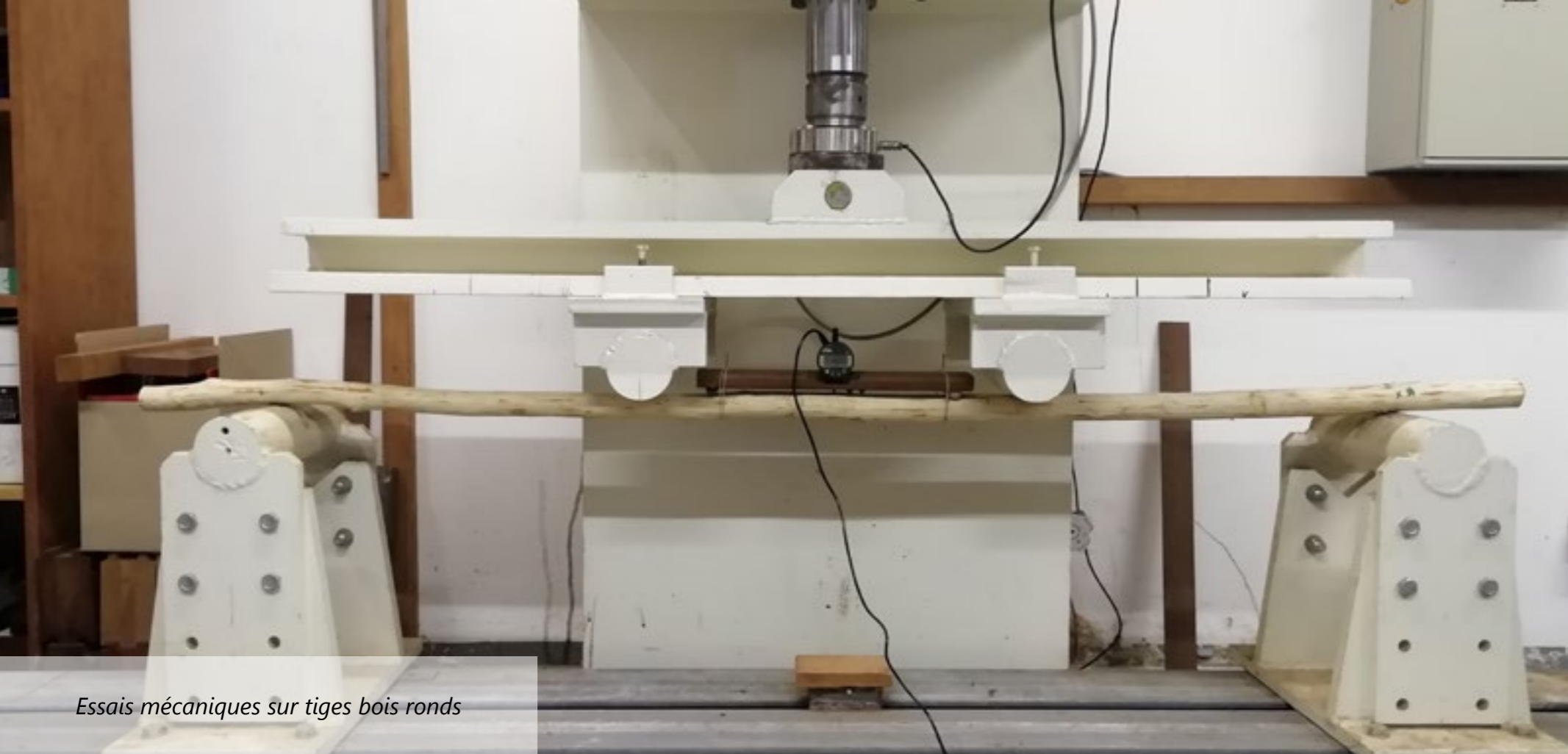
Essais mécaniques sur tiges bois ronds