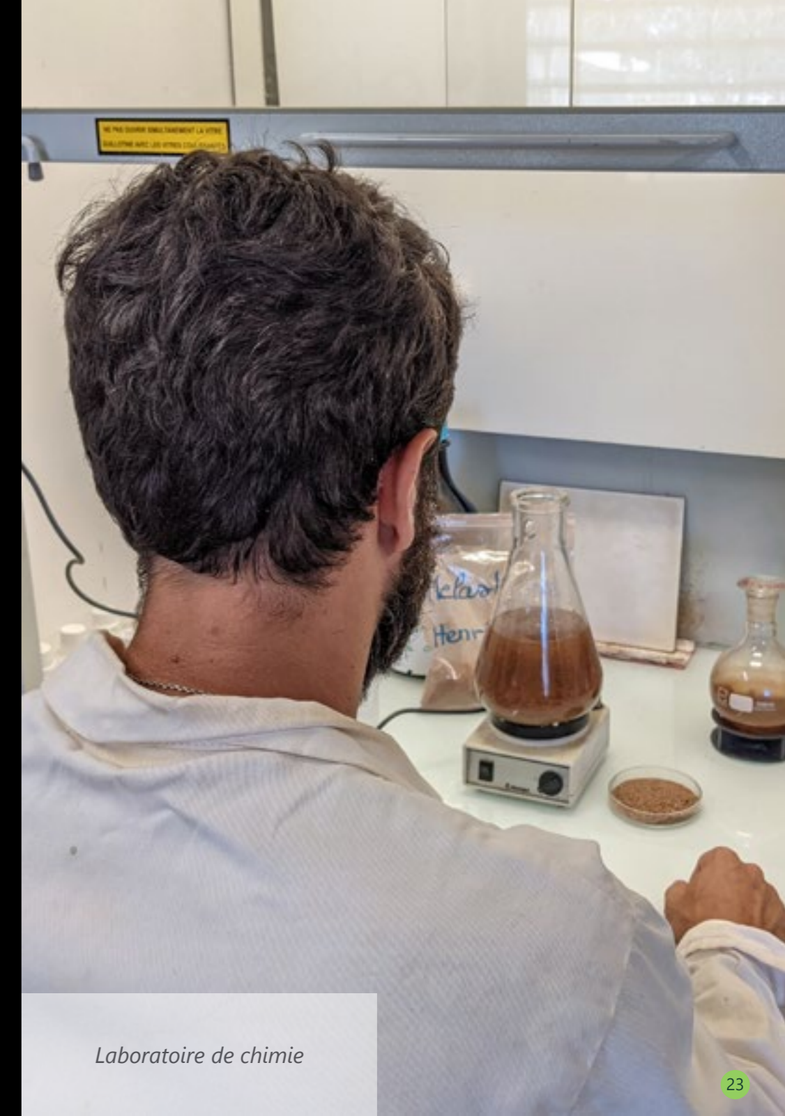
Laboratoire de chimie