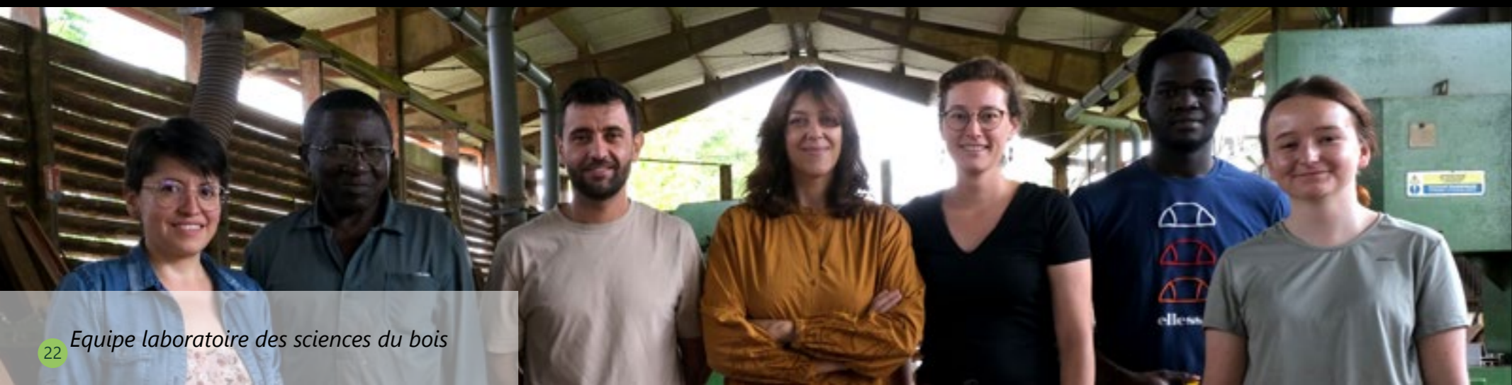
Equipe laboratoire des sciences du bois