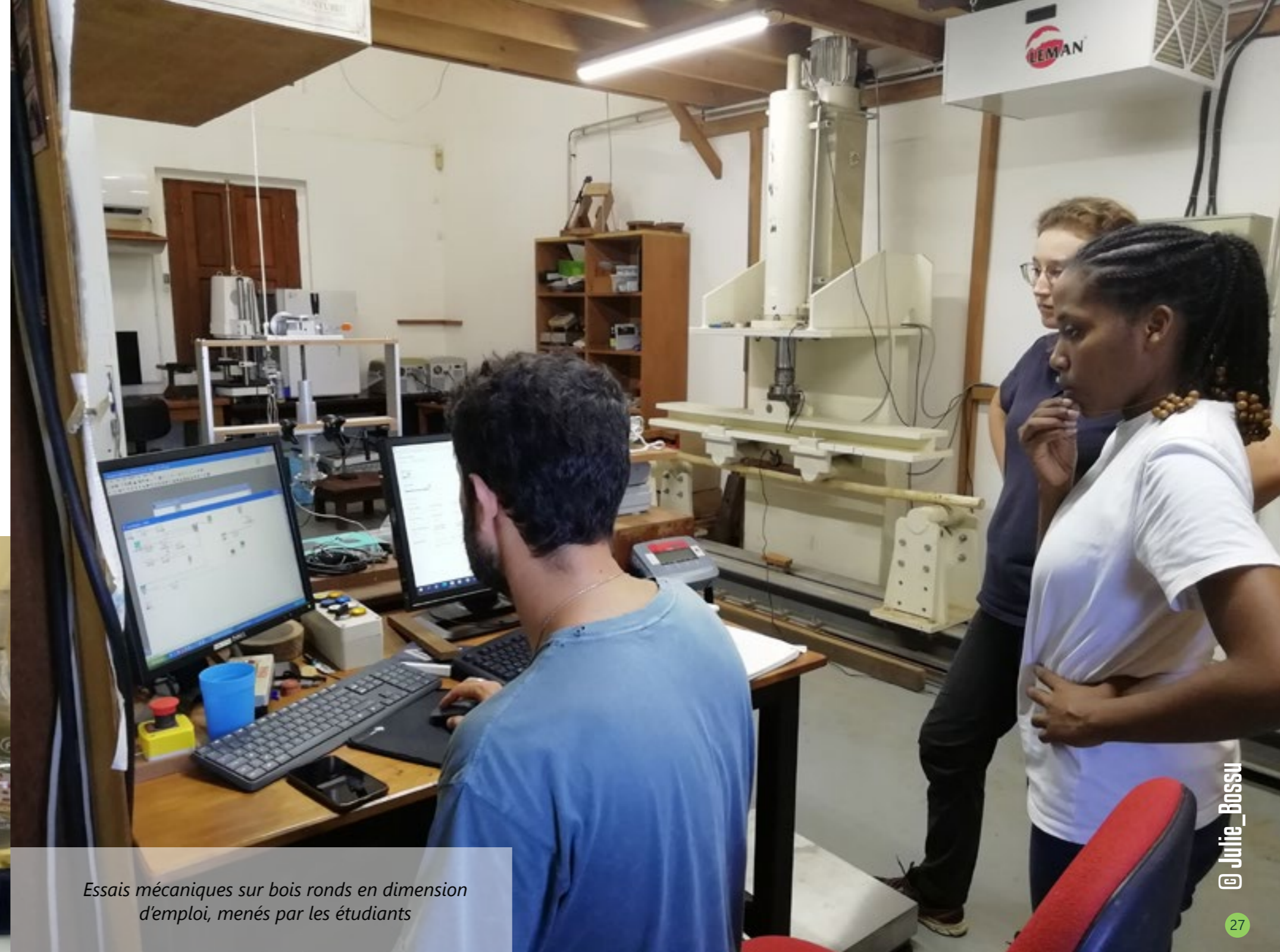
Essais mécaniques sur bois ronds en dimension d'emploi, menés par les étudiants